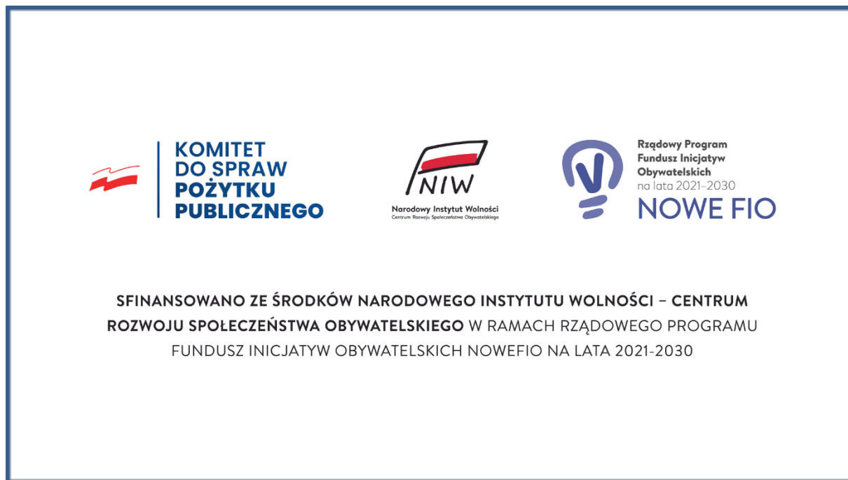
Tablica nr 2 do filmików